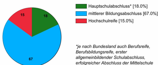
Ausbildungsanfänger/innen 2019 (in %)

Rechtlich ist keine bestimmte Schulbildung vorgeschrieben. In der Praxis stellen Verwaltungen und Betriebe überwiegend Auszubildende mit mittlerem Bildungsabschluss ein.